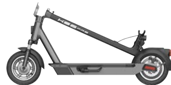
折りたたみカンタン 車のトランクにも積載OK

サスペンション ドラムブレーキ 尾灯 制動灯 ナンバープレート ディスクブレーキ 電子ブレーキ